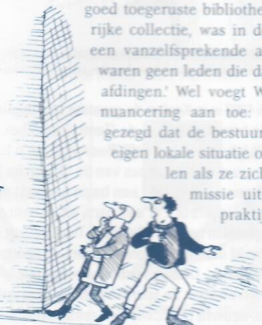
Tekening: Jo Nesbitt